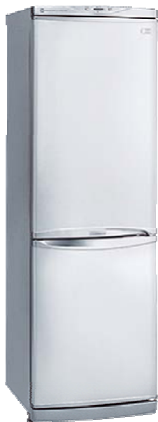
COMBI ELECTRÒNIC LG REF.GR.389SQA Blanc, mides 188x595x626, A, 380l, no frost, alarma obertura.