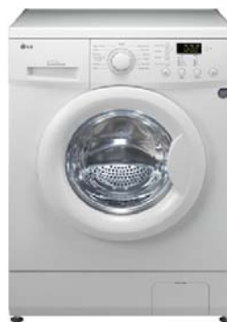
RENTADORA LG REF.WD10810MD Rentadora 1000rpm 8kgs consum A+ display electronic