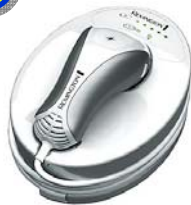
FOTO DEPILADORA REMINGTON